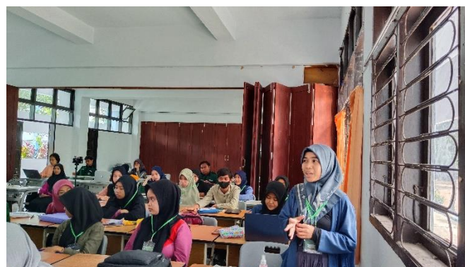
Gambar 3. Sesi tanya jawab dengan peserta pelatihan

Menurut Saparuddin dkk (2022), Canva digunakan untuk menghasilkan media visual berupa infografis dan media presentasi untuk kegiatan ini. Canva adalah aplikasi desain grafis yang memungkinkan pengguna untuk membuat desain kreatif dengan cara yang praktis karena ada ribuan template tersedia. Ada berbagai fitur gratis dengan penggunaan yang praktis termasuk berbagai format unduhan dalam setiap template yang digunakan. Platform lain yang diperkenalkan adalah prezi. Menurut Wardani (2015), Prezi adalah sebuah software yang dapat membantu membuat slide untuk presentasi yang menarik dan kreatif secara online. Berbeda dari powerpoint prezi memberikan ruang/kanvas yang cukup luas untuk menuangkan ide kreatif pembuat slide. Optimalisasi media presentasi berbasis Prezi mampu memberikan manfaat yang sangat baik bagi pengguna pada saat ini, karena lebih interaktif dan inovatif. Pada tahap ini, peserta antusias memperhatikan materi, karena peserta diajak langsung untuk menjelajahi setiap fitur yang ada dalam dua platform besar tersebut. Antusiasme peserta tergambar dari banyaknya pertanyaan yang muncul saat sesi tanya jawab.