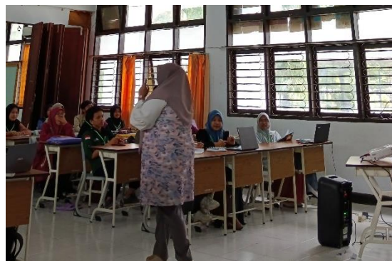
Gambar 2. Tim Pengabdian membawakan materi tentang teknik membuat media presentasi

Tahapan selanjutnya adalah tahap pelaksanaan yang terdiri atas 3 sesi. Sesi pertama adalah Penyampaian materi. Pada sesi ini, tim pengabdian memaparkan materi tentang Teknik membuat presentasi yang menarik dengan memperkenalkan beberapa platform seperti canva.