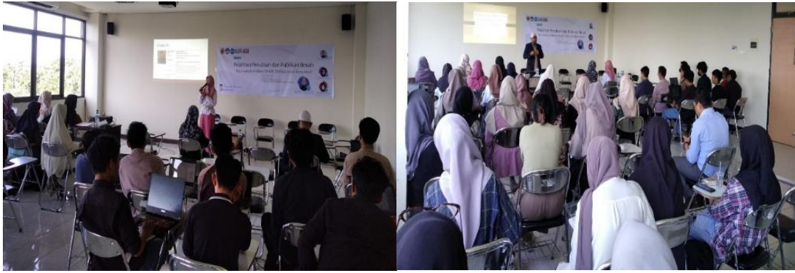
Gambar 1. Penyampaian Materi Pelatihan