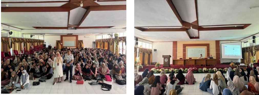
Gambar 2. Sesi interaktif

Kegiatan pengabdian edukasi penggunaan aplikasi Mendeley kepada mahasiswa Administrasi Kesehatan Universitas Negeri Makassar ini dilakukan dengan sesi interaktif dan pendampingan individu kepada mahasiswa yang memiliki hambatan. Pendampingan paling banyak dilakukan kepada peserta dengan hambatan tidak bisa menghubungkan aplikasi Mendeley dengan lembar kerja Ms. Word.