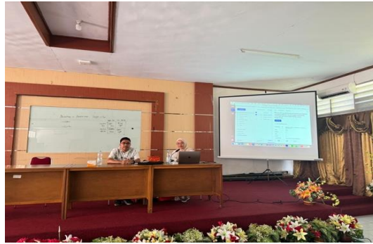
Gambar 1. Pengenalan aplikasi Mendeley

Aplikasi Mendeley adalah perangkat lunak open-source yang tersedia secara gratis bagi dosen, peneliti, dan mahasiswa untuk mengelola dan mengatur dokumen serta referensi ilmiah. Aplikasi ini berfungsi sebagai alat manajemen referensi yang membantu dalam mengatur artikel ilmiah, membuat kutipan, dan menyusun daftar pustaka secara otomatis (Pramiastuti et al., 2020). Manfaat menggunakan Mendeley adalah sebagai berikut (Dhabytha et al., 2022):